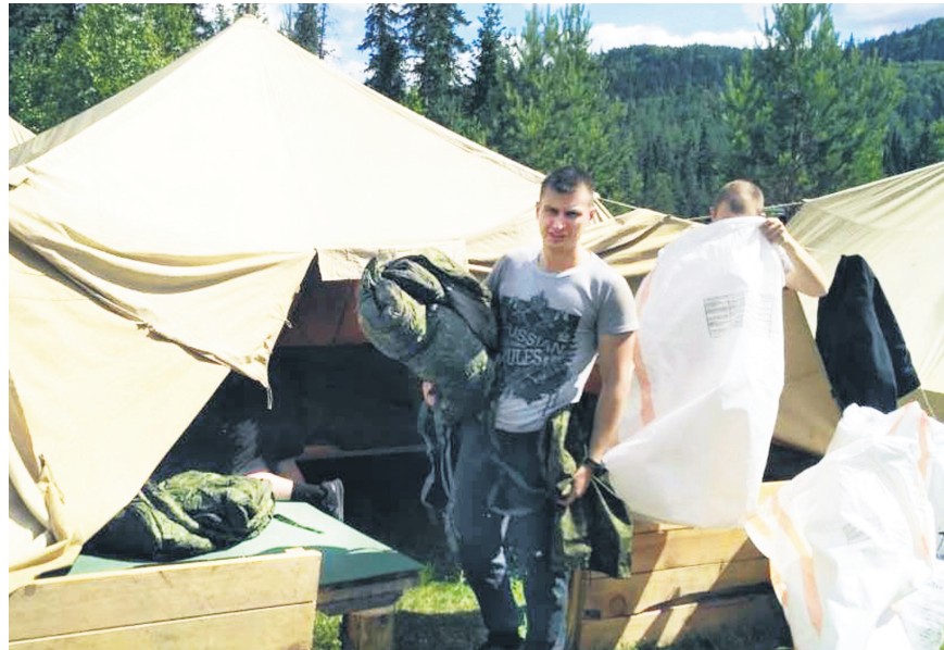
Проведённые в палаточном лагере «Десантник» дни запомнились всем ребятам.

Многие проблемы неустроенности, дискомфорта проживания можно устранить с помощью полученных финансовых грантов. Средства грантов можно расходовать и на оплату труда, и на приобретение оборудования. Среди наших земляков много людей с запасом идей,