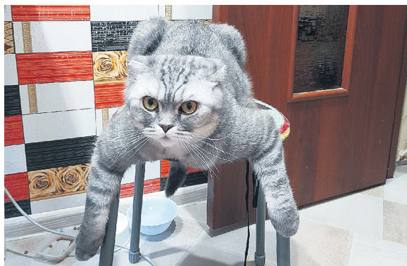
Кот Пушок. Хозяйка — Ангелина Карягина.

В социальных сетях ВКонтакте и Одноклассники мы предложили подписчикам прислать в комментарии фото своих мурлык. Продолжаем знакомить с ними и вас.